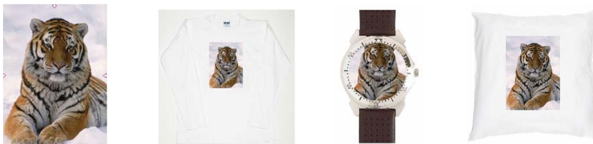
Exemples de personnalisation d'après une image de la galerie

Service totalement unique en Europe, myPIXmania a ouvert sa propre galerie photo, soit plus de 50 000 images en droits gérés à la disposition des internautes. Des photos de renoms prises par des photographes professionnels illustrant plus de 20 domaines divers et variés (nature, loisirs, insolite...). Libre choix des internautes de les développer sur papier ou d'en étoffer les objets personnalisés de la rubrique « Idées Cadeaux » du site.