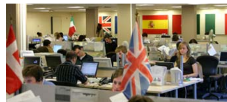
Le centre d'appel

Le site myPIXmania est aujourd'hui présent sur 11 pays européens : France, Royaume-Uni, Italie, Espagne, Allemagne, Pays-Bas, Suisse, Irlande, Suède, Autriche et Belgique. Pour répondre aux exigences des internautes myPIXmania a également internalisé son centre d'appel international, véritable plate-forme multi culturelle. Une extension à 15 pays est prévue pour 2006.