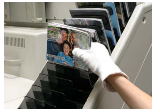
Le laboratoire myPIXmania

Augmentant de 500% sa croissance avec 70 000 000 de tirages en 2005-2006, myPIXmania illustre l'explosion du marché de la photo numérique.